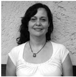
Fotografía: Jorge Salort

1983/85 Temple con el maestro Luis Eduardo Jurado, Cuernavaca, Mor. • 1986/88 Dibujo y óleo con la maestra Elisa Cano, Cuernavaca, Mor. • Enero 2007 Programa de Arte Dhármico Intensivo de Artes Contemplativas / Entrenamiento de maestro de Artes Contemplativas, Los Ángeles, California, USA • Desde enero 2007, Técnicas del agua con el maestro Huáscar Taborga, Cuernavaca, Mor. • Desde octubre 2007 Composición y creatividad con el maestro Jorge Salort, acuarela y acrílico, Cuernavaca, Mor. • Marzo 2007 Exposición colectiva en el centro de Shambhala, Técnica mixta de tinta china. Tepoztlán, Mor. • Junio 2007 Exposición colectiva, segunda muestra del Taller de las Aguas. Centro Cultural Universitario. Cuernavaca, Mor. • Agosto 2007 Seleccionada en el 1º Salón Regional de la Acuarela 2007 "El Anillo". Centro Cultural Jardín Borda. Cuernavaca, Mor. • Marzo 2008 Exposición colectiva en el centro de Shambhala, Tepoztlán, Mor. • Julio 2008 Exposición colectiva, tercera Muestra Pictórica del Taller de las Aguas. Galería Arte Tamayo. Cuernavaca, Mor. • Septiembre 2008 Mención Honorífica en el XI Salón de la Acuarela 2008. Centro Cultural Jardín Borda. Cuernavaca, Mor. • Noviembre 2008 Exposición colectiva "De Cuántas Formas" Alianza Francesa. Cuernavaca, Mor. • Octubre 2009 Exposición colectiva "Concordancia 7". Museo Nacional de la Acuarela. México, D.F.